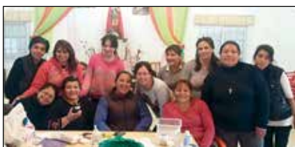
Mujeres del grupo Killar

Por otra parte se encuentra activa la Mesa de Líderes Promotores de Salud, Fruto del programa “Liderar Tu Vida, te Hace Bien”. De este proyecto participan 23 escuelas secundarias con 50 docentes, promotores de salud comprometidos y 350 adolescentes Líderes, hacen