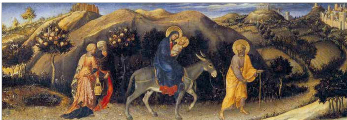
Huida a Egipto. Pintura de Fr. Angélico