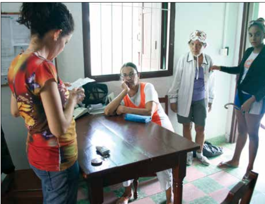
Doctora recibiendo a una paciente

Los medicamentos más requeridos y necesarios serían las vitaminas (B1, B2, B6, y multivitaminas), las pomadas antiescaras, los antibióticos de amplio espectro, los analgésicos, contra cualquier tipo de dolor, antiparasitarios intestinales. Todo esto y más, es bien necesario y bien recibido aquí. Pero lo que más se agradece es el cariño y delicadeza de todas las personas que se preocupan por llevar un poco de ayuda a la otra parte del mundo y la de las personas que aquí la distribuyen a quienes se acercan a solicitarlas.