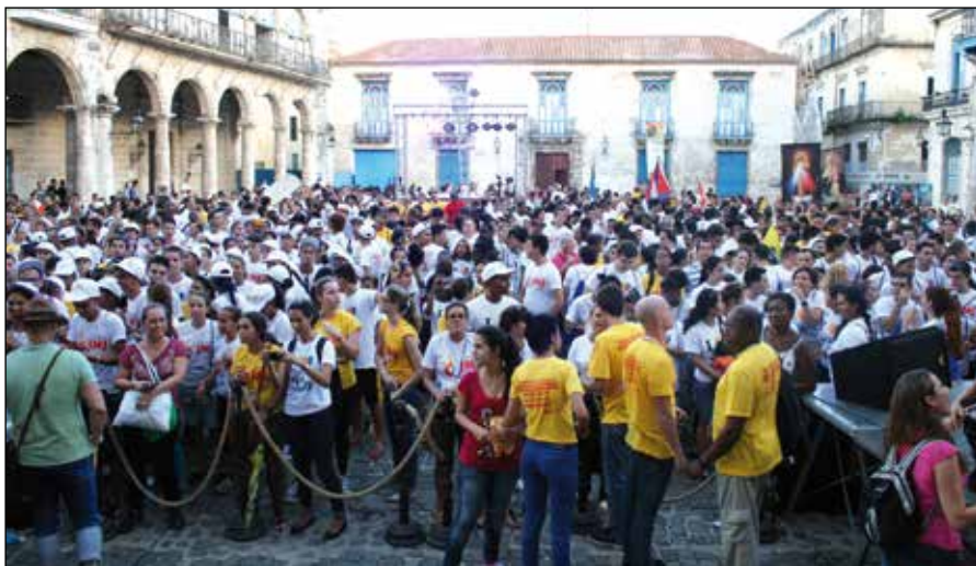
Jóvenes en la Plaza de la Catedral

Tras la cena al aire libre, todos se van reuniendo en la explanada del castillo de la punta, junto al malecón, para al atardecer dar comienzo a un emotivo y brillante Viacrucis por las calles del centro de La Habana. El Viacrucis es vivido con gran fe y devoción, combi-