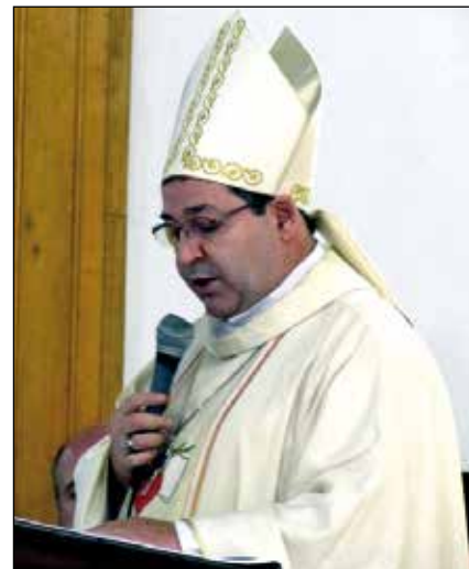
Mons. Olaortua pronunciando una homilía

A lo largo del año, ya se están realizando las distintas peregrinaciones a la Catedral. Como Obispo, he recomendado vivamente a los párrocos y a los responsables de los movimientos eclesiales a que hagan su peregrinación a la Catedral para entrar por la Puerta Santa y, con las debidas disposiciones, ganar las indulgencias. Además de la primera popular con ocasión de la apertura de la Puerta Santa, ya han sido varias las parroquias y asociaciones que han ganado su jubileo, comenzando por los más lejanos de la Parroquia San Agustín de Intuto en el río Tigre. También he acudido a la cárcel para que los presos puedan ganar su jubileo -como indica el Papa- atravesando la puerta de su celda o de la capilla. En esa celebración jubilar también confirmé a algunos de los residentes en el penal. Tampoco nos ha faltado el marketing publicitario. Desde las distintas parroquias y comisiones se han hecho estampas, calendarios de pared y de bolsillo,