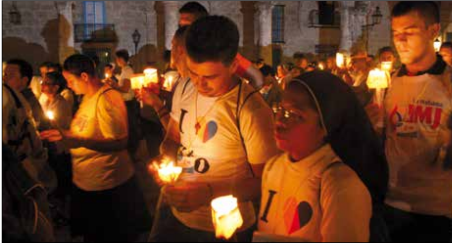
Vigilia de oración

nando los cantos con los momentos de oración y de silencio. Llama la atención de turistas y habitantes de la ciudad que se preguntan si tal manifestación es algo que se celebra con motivo del próximo cumpleaños de Fidel. Con velas encendidas, y cantando el himno oficial de la jornada se llega a la catedral y se atraviesa la puerta santa cumpliendo del deseo del Papa manifestado en el mensaje para esta jornada: dejarse inundar del amor de Dios. Dentro de la catedral todos pueden escuchar el mensaje que el santo padre ha dado al terminar el viacrucis en Cracovia.