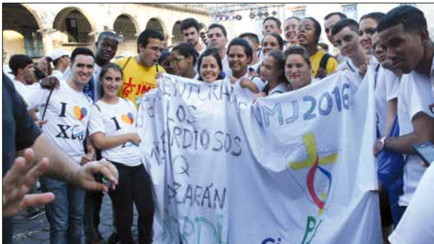
Jornada Mundial de la Juventud en La Habana

“Bienaventurados los misericordiosos, porque ellos alcanzarán misericordia”. (Mt 5,7)