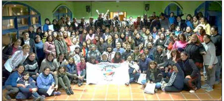
Miembros de la Organización para la Promoción de la Vida

posible espacios de reflexión, capacitación y sensibilización sobre diversos temas.