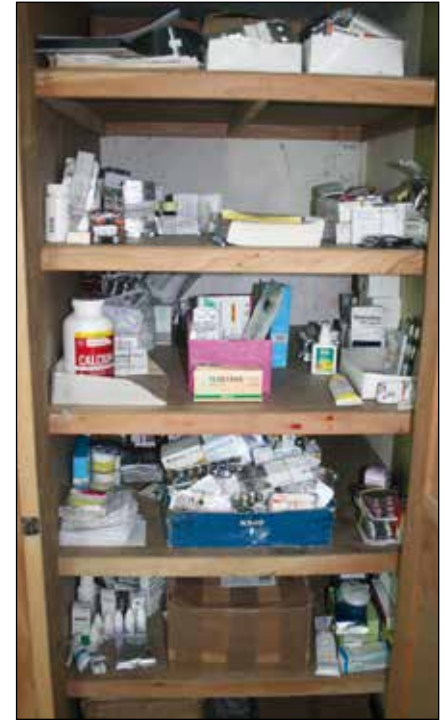
Botiquín de medicinas

A través de donantes de otros países se ha venido recibiendo medicamentos que han llegado donados por farmacias y particulares, que colaboran con productos sobrantes en buen estado pero que tienen una fecha próxima de caducidad. Periódicamente se reciben paquetes, de unos tres kilos, con estos productos procedentes de España. Se trata de un proyecto que ya lleva