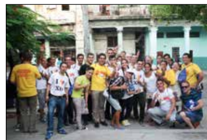
Participantes en la jornada

Presiden el acto la cruz peregrina, regalada por el Papa Francisco en su reciente visita a la isla y la patrona de Cuba, la Virgen de la Caridad. Tras las palabras del arzobispo de la Habana, monseñor Juan, la gran sorpresa de la noche fue el mensaje del santo Padre grabado especialmente para los jóvenes que participaban en el encuentro de la JMJ en La Habana. En él el Papa les invitaba a es-