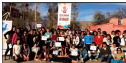
Grupo de líderes.

posible espacios de reflexión, capacitación y sensibilización sobre diversos temas.