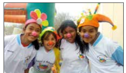
Actividad lúdica con adolescentes.