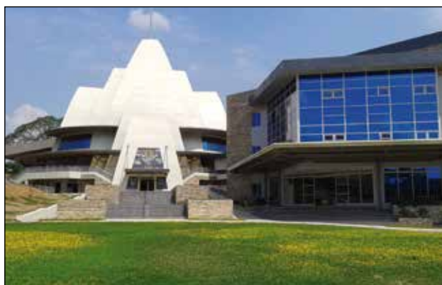
Nueva iglesia y colegio de Bulacán

con un primer grupo de 40 alumnos. En las previsiones se espera que, en un futuro de diez años se alcance la cifra de varios miles. Incluso se piensa que podrá convertirse en universidad.